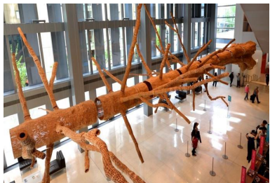
西雅图艺术博物馆